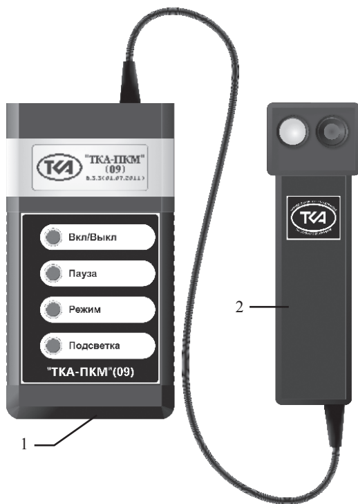
Рис.1. Внешний вид прибора “TKA-ПКМ”(09)