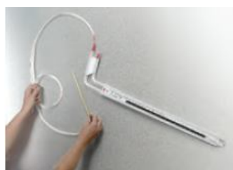
Модель 1227 установленная в наклонном положении.