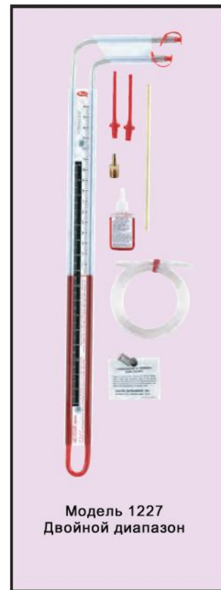
Модель 1227 Двойной диапазон

Две пластиковые транспортировочных пробки с фиксаторами для использования, когда манометр выведен из эксплуатации. Два магнитных фиксатора удерживает прибор на металлической поверхности. Гибкие красные виниловые пластиковые трубные соединения. Латунная концевая трубка диаметром 6мм x длину 200мм. Один держатель концевой трубки. Латунный адаптер, трубная резьба 1/8" и пластиковая трубка. Одна пластиковая трубка Tygon® длиной 1.5 м.. Один флакон 220 г с красной манометрической жидкостью с уд. весом 0,826. Виниловый футляр для переноски.