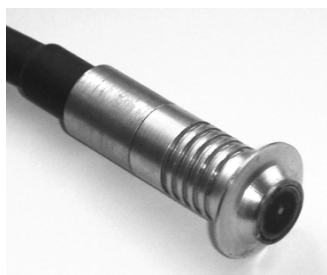
Преобразователи ультразвуковой и электромагнитный