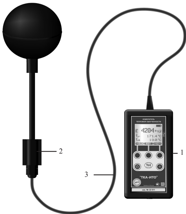
Рис.1. Внешний вид прибора “ТКА-ИТО”.