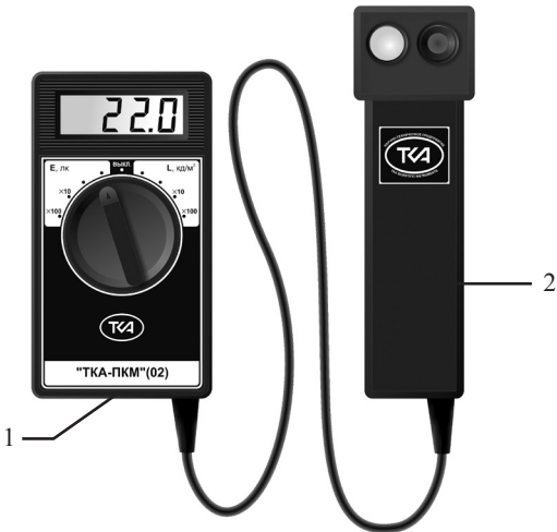
Рис.1. Внешний вид прибора “ТКА-ПКМ”(02)