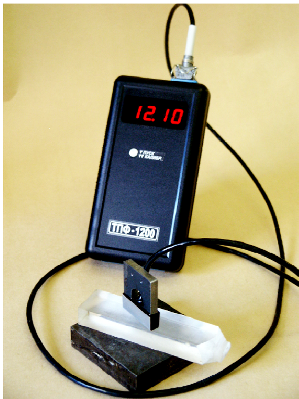
Рис.1. Общий вид магнитного толщиномера ТПФ-1200