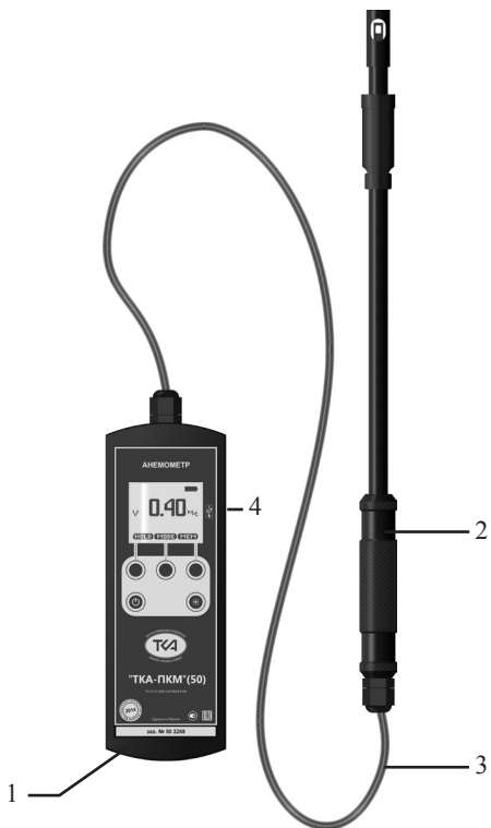
Рис.1. Внешний вид прибора “ТКА-ПКМ”(50)