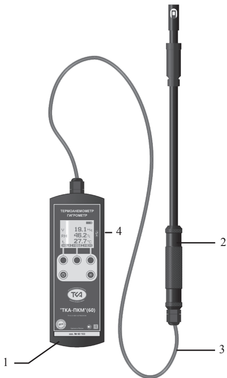
Рис.1. Внешний вид прибора “ТКА-ПКМ”(60)