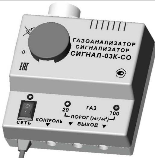
Рис. 1. Общий вид сигнализатора «Сигнал-03К-СО»