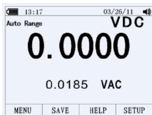
Подрежим DC AC

В режиме измерения AC– и DC–сигналов недоступны дополнительные режимы измерений: PEAK, Hz, ms, %, REL, MIN, MAX, REL .