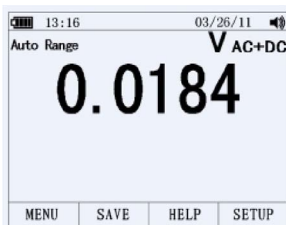
Подрежим AC + DC