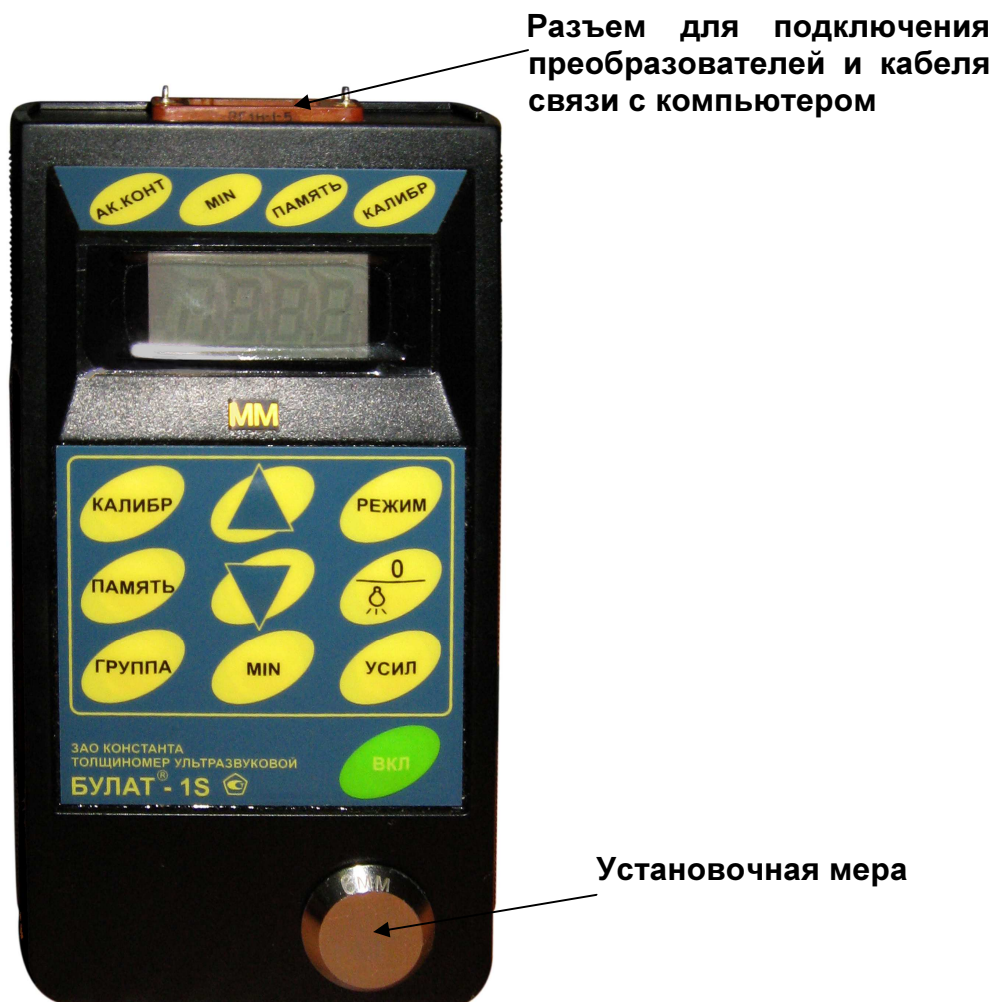
Рис.1. Булат 1S

Расположение клавиатуры и индикатора на лицевой панели блока обработки информации прибора приведено на рисунке 1.