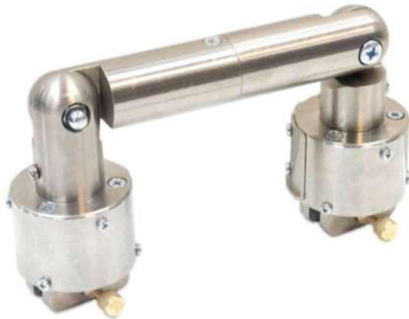
Рис.3. Намагничивающие блоки, соединенные шарнирным магнитопроводом.