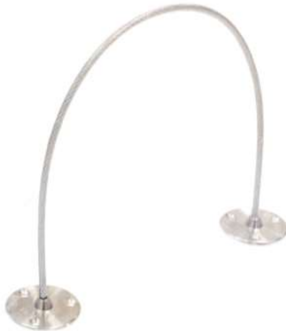
Рис.4. Тросовая перемычка.