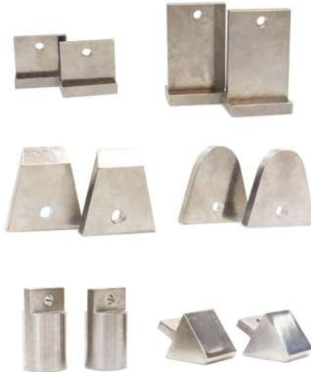
Рис.2 Полюсные наконечники.

Для крепления полюсных наконечников (рис.2), намагничивающие блоки имеют проушины, в которые вставляются наконечники и фиксируются стопорным винтом.