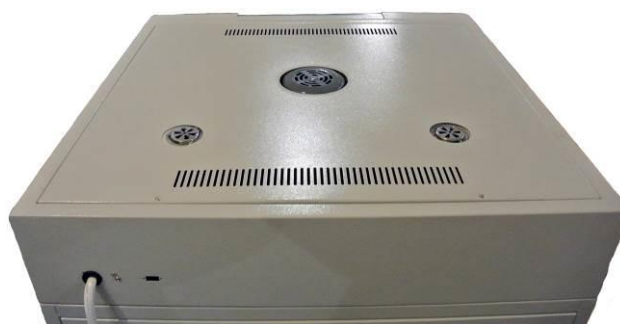
Рис. 2. Шкаф сушильный. Вид сверху.

На верхней панели (см. рис. 2) шкафа расположено отверстие для установки контрольного термометра и отвода влаги. Термометр в комплект поставки шкафа не входит.