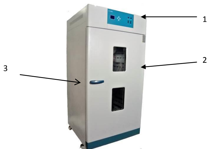
Рис. 1. Шкаф сушильный. Общий вид.

Общий вид шкафа показан на рис. 1. Шкаф выполнен в виде единого блока, на передней панели которого расположены: панель управления (1), дверца со смотровым окном (2), дверца запирается на замки, открываемый при помощи ручки (3).