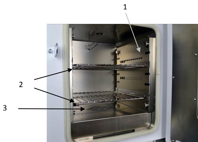
Рис. 3. Шкаф сушильный. Рабочая камера.

За дверцами располагается рабочая камера шкафа (см. рис. 3), оборудованная нагревателями и направляющими (1) для полок (2). Нижняя стенка рабочей камеры имеет вентиляционные отверстия (3), через которые горячий воздух при помощи вентилятора распределяется равномерно по объему камеры.