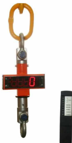
Весы МК-ХС с пультом дистанционного управления.