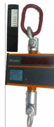
Весы МК-ХЛ с пультом дистанционного управления.