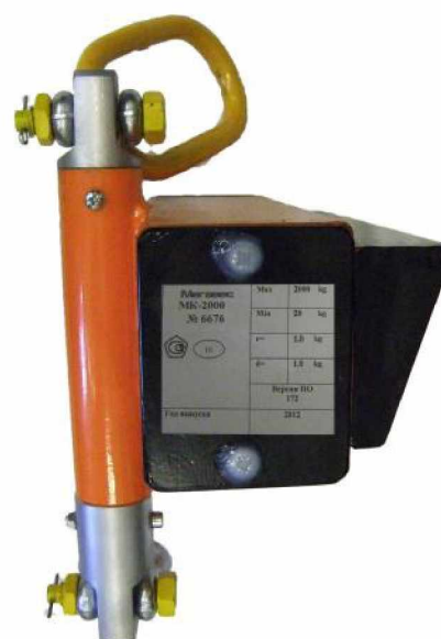
Маркировка весов электронных крановых МК-ХЛ Маркировка весов электронных МК-ХС Рисунок 2 Маркировка весов электронных крановых МК