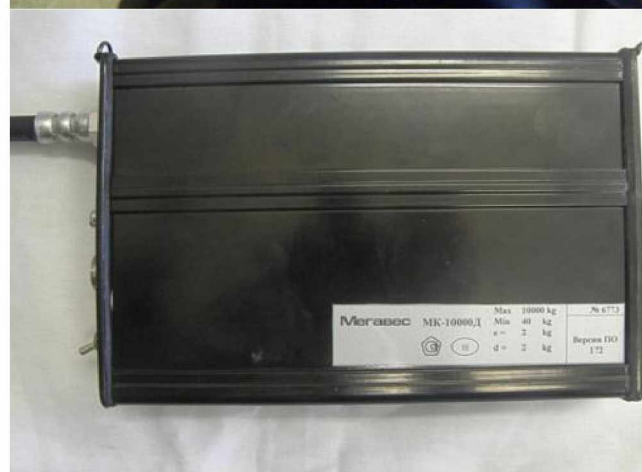
Маркировка весов электронных крановых МК-ХД