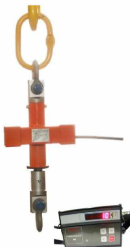
Весы МК-ХД с внешним индикатором