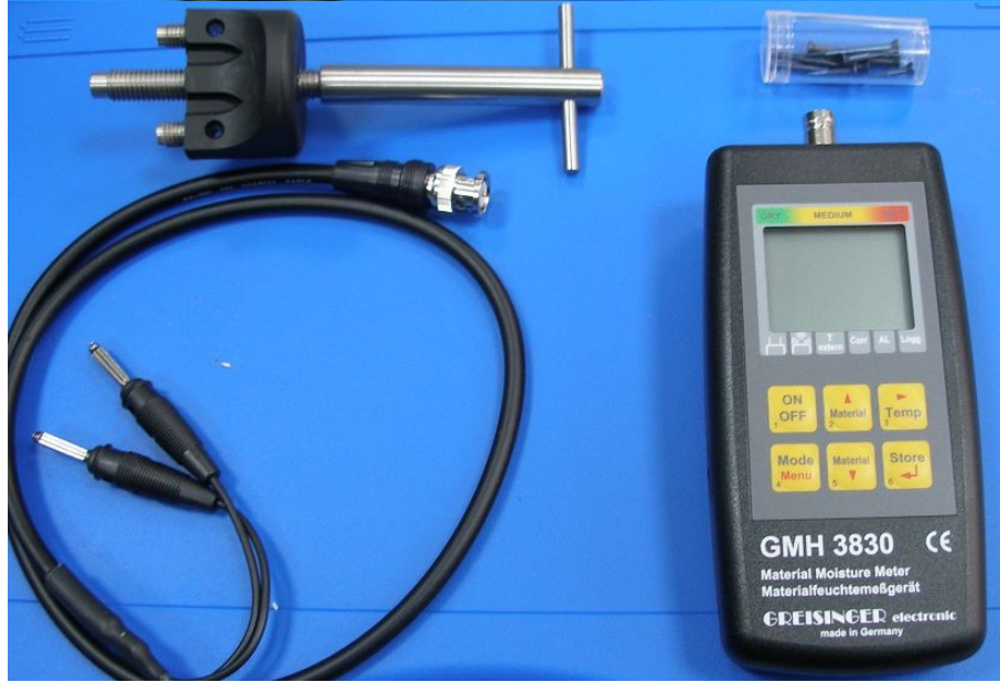
Вариант-3: для твердой древесины на глубине 5 см. и мягких строительных материалов