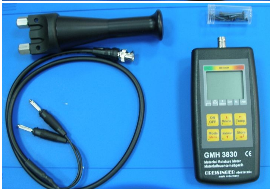
Вариант-2: для древесины на глубине 5 см. и мягких строительных материалов