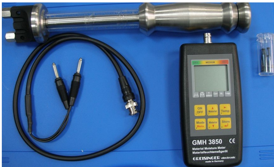
Вариант-1: для древесины на глубине от 5 до 20 см.