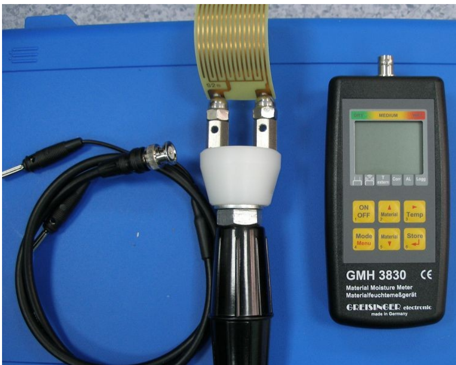
Вариант-9: для бумаги, картона и текстиля