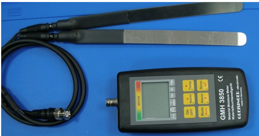
Вариант-8: для бумаги, картона и текстиля