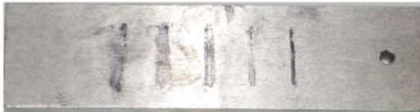
Рис. 7. Дефектограмма искусственных дефектов на образце МО-3