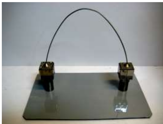
Рис.5. Намагничивающие блоки, соединенные между собой тросовой перемычкой,