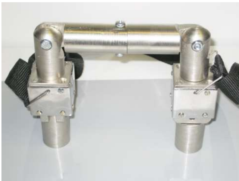
Рис.4. Намагничивающие блоки, соединенные шарнирным магнитопроводом, на проверяемой детали.