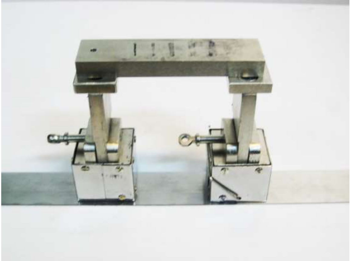
Рис.6. Положение образца МО-3 в намагничивающих блоках при проверке работоспособности дефектоскопа и качестве суспензии.