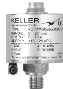
PD-41 X Размеры ø 50 x 62 мм

** точность будет ухудшаться пропорционально