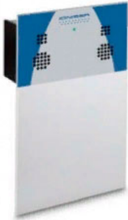
Задняя панель ветрозащиты со встроенным ионизатором