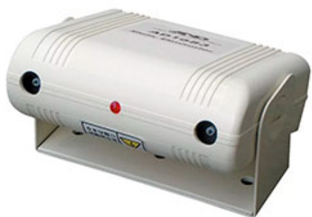
AD-1683 - Устройство для снятия статического заряда