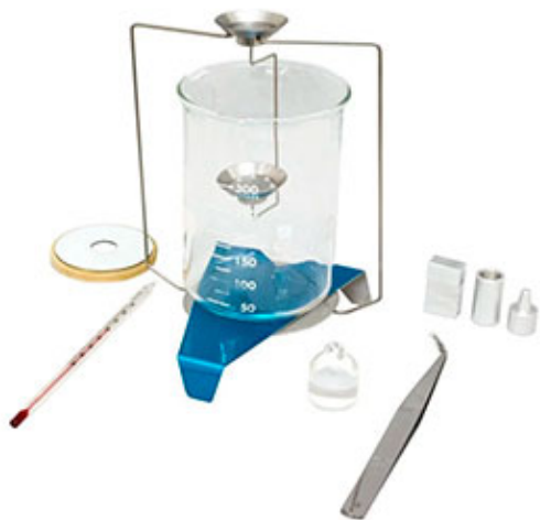
AD-1654 - Комплект для определения плотности