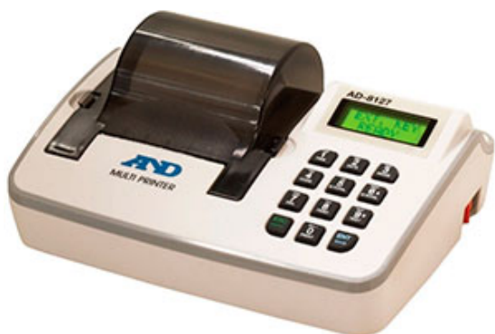
AD-8127 - Компактный принтер