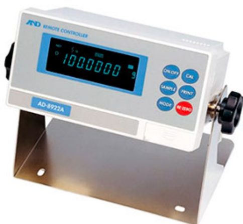
AD-8922A - Блок дистанционного управления